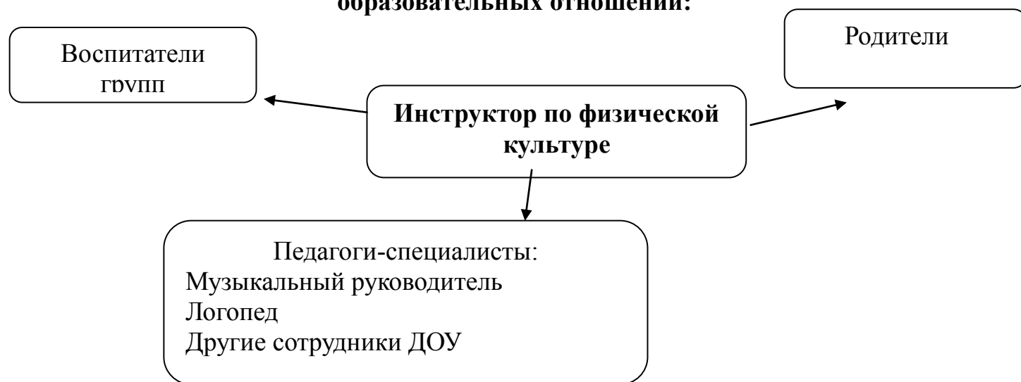
Схема организации работы по взаимодействию с участниками образовательных отношений:

Инструктор по физической культуре работает в тесном контакте со всеми участниками образовательных отношений по достижению цели и реализации задач программы.