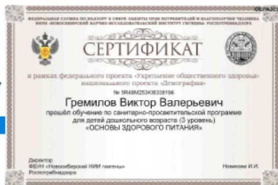
Рис. 15. – Просмотр результатов итогового тестирования и получение сертификата, подтверждающего успешность прохождения обучения

В случае если набрано менее 80% правильных ответов, Программа указывает проблемные разделы и предлагает пройти тестирование повторно. Количество повторных тестирований не ограничено по количеству, но ограничено по времени. Повторное тестирование можно пройти не ранее чем через 24 часа от предыдущего тестирования.