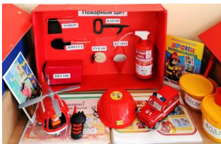
1-я младшая группа

В каждой возрастной группе есть свой план работы по формированию основ пожарной безопасности у дошколят. Педагоги делают подборку сюжетных картинок, сказок и рассказов, загадок и стихов для организации работы по этому плану. В группах созданы уголки безопасности.