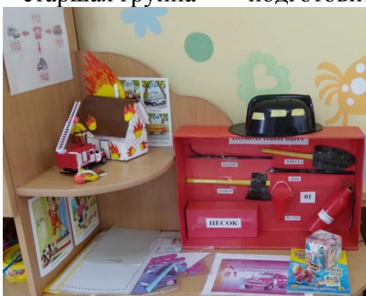
2-я младшая группа